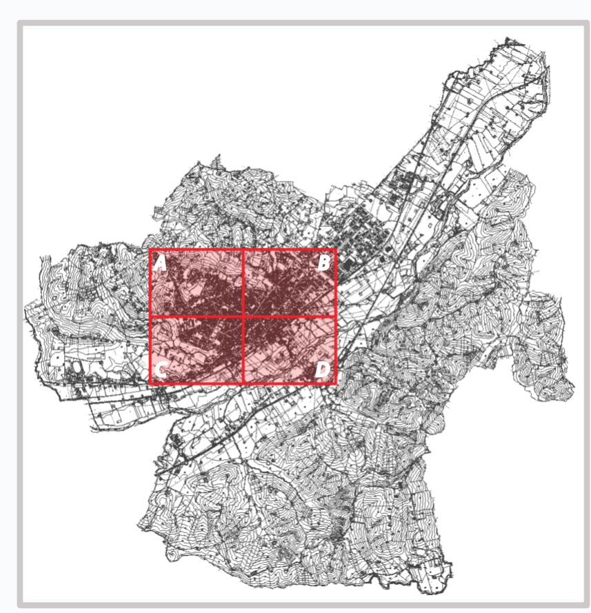
Ambito del territorio comunale in oggetto di rilievo Identificazione dei quadranti