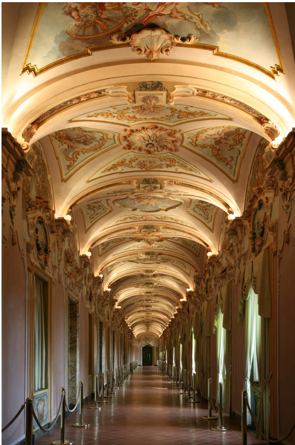
Palazzo Pianetti – Galleria degli stucchi