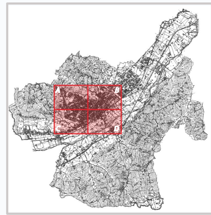
Ambito del territorio comunale in oggetto di rilievo Identificazione dei quadranti