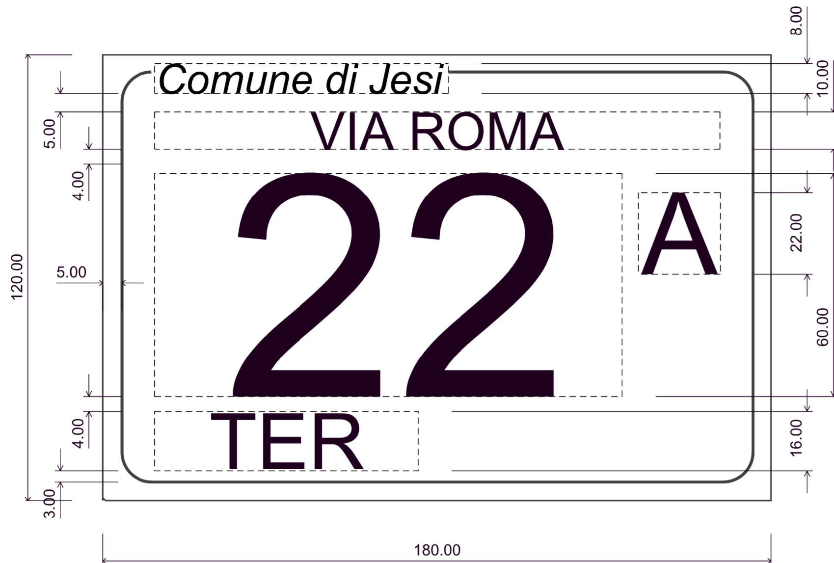
Dimensioni in mm delle targa della numerazione civica esterna